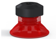
Variantenreferenz: 99A 20PU FM5GIC • Farbe: Rot • Shore-Härte: SH40