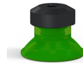
Variantenreferenz: 99B 20PU FM5GIC • Farbe: Grün • Shore-Härte: SH60