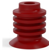
Variantenreferenz: 95-2 40SL A