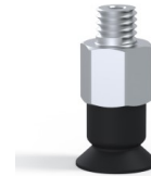
Variantenreferenz: 7SB 10NI M5