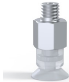
Variantenreferenz: 7SB 10SLT M5