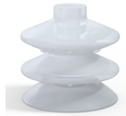
Variantenreferenz: 8 87SLT A