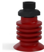
Variantenreferenz: 95-2 40SL 38D-2