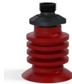
Variantenreferenz: 95-2 40SL 14D-2