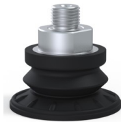
Variantenreferenz: 8R 52NI M14