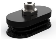
Variantenreferenz: 4R 62NR M14