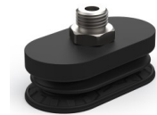
Variantenreferenz: 4R 62NI M14