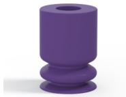
Variantenreferenz: 1 09MNT A