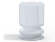
Variantenreferenz: 1 09SLT A