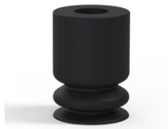
Variantenreferenz: 1 09NI A