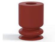
Variantenreferenz: 1 09SL A