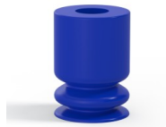
Variantenreferenz: 1 09PU A