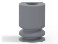
Variantenreferenz: 1 09NR A