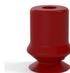
Variantenreferenz: 1 10SL A