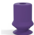
Variantenreferenz: 1 10MNT A