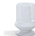
Variantenreferenz: 1 10SLT A