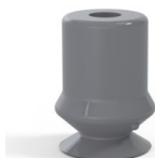
Variantenreferenz: 1 10NR A