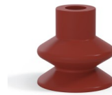
Variantenreferenz: 1 27SL A