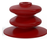
Variantenreferenz: 8 120SL A