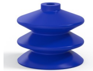
Variantenreferenz: 2 61PU A