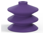
Variantenreferenz: 2 61MNT A