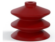
Variantenreferenz: 2 61SL A