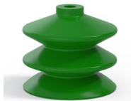
Variantenreferenz: 2 61SLV A