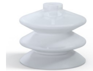
Variantenreferenz: 2 61SLT A