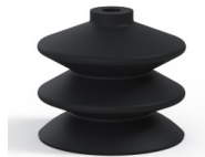
Variantenreferenz: 2 61NI A