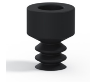
Variantenreferenz: 21 05NI A