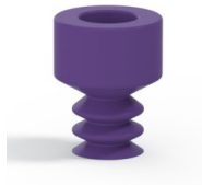
Variantenreferenz: 21 05MNT A