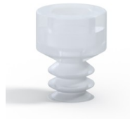
Variantenreferenz: 21 05SLT A