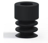
Variantenreferenz: 21 07NI A