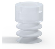
Variantenreferenz: 21 07SLT A