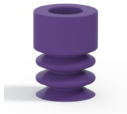
Variantenreferenz: 21 07MNT A