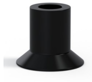
Variantenreferenz: 73A 20PARA A