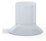
Variantenreferenz: 73A 20SLT A