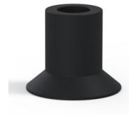
Variantenreferenz: 73A 20NI A