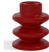
Variantenreferenz: 80A 30SL A