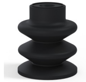
Variantenreferenz: 80A 30NI A