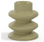
Variantenreferenz: 80A 30CN A