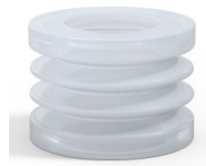
Variantenreferenz: 80S 45SLT A