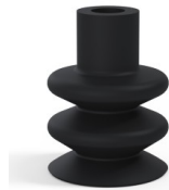
Variantenreferenz: 8B 40NI A