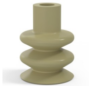
Variantenreferenz: 8B 40CN A