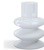
Variantenreferenz: 8B 40SLT A