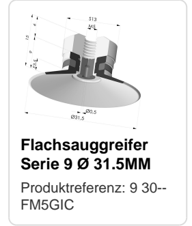
Flachsauggreifer Serie 9 Ø 31.5MM