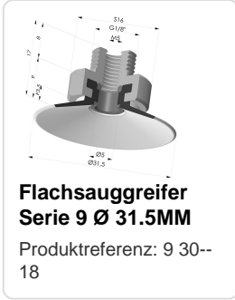
Flachsauggreifer Serie 9 Ø 31.5MM