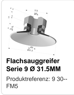
Flachsauggreifer Serie 9 Ø 31.5MM