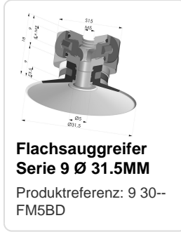
Flachsauggreifer Serie 9 Ø 31.5MM