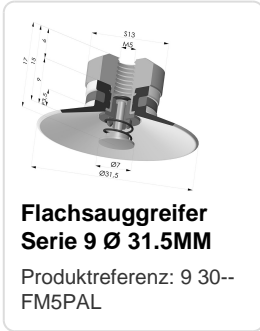
Flachsauggreifer Serie 9 Ø 31.5MM