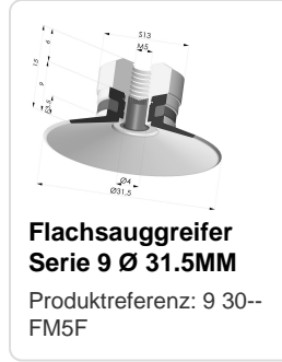
Flachsauggreifer Serie 9 Ø 31.5MM