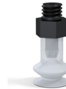
Variantenreferenz: 91 08SLT M5M