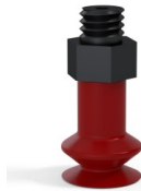
Variantenreferenz: 91 08SL M5M