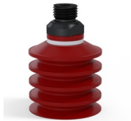
Variantenreferenz: 92 40SL 14D-2-F