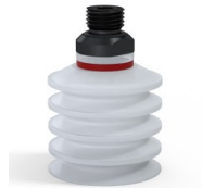
Variantenreferenz: 92 40SLT 14D-2-F