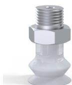
Referencia de la variante: 8SB 15SLT M18