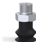
Referencia de la variante: 8SB 15NI M18