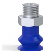
Referencia de la variante: 8SB 15TPUB M18