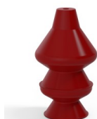
Referencia de la variante: 81 30SL A