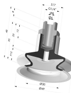
Ventosa 1.5 Fuelles Serie 8A Ø 49MM