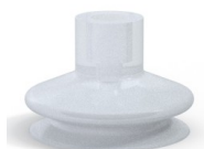
Referencia de la variante: 8A 50SLT A