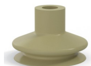
Referencia de la variante: 8A 50CN A