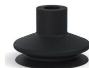
Referencia de la variante: 8A 50NI A