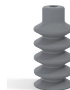
Referencia de la variante: 88 18NR A