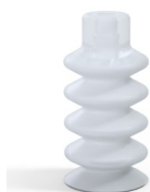
Referencia de la variante: 88 18SLT A SH40