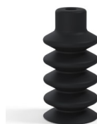
Referencia de la variante: 88 18NI A