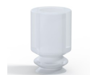
Referencia de la variante: 1 05SLT A