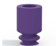
Referencia de la variante: 1 05MNT A