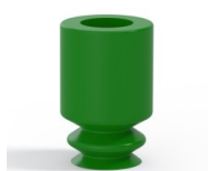
Referencia de la variante: 1 05SLV A