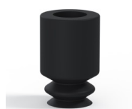
Referencia de la variante: 1 05NI A