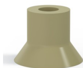
Referencia de la variante: 73 40CN A