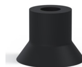
Referencia de la variante: 73 40NI A