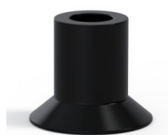
Referencia de la variante: 73A 20PARA A