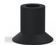
Referencia de la variante: 73A 20NI A