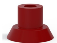
Referencia de la variante: 75 15SL A