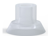
Referencia de la variante: 75 15SLT A SH40