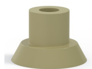
Referencia de la variante: 75 15CN A