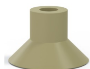
Referencia de la variante: 78 30CN A