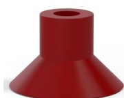
Referencia de la variante: 78 30SL/RV A