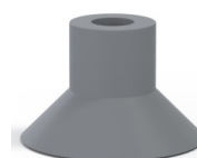
Referencia de la variante: 78 30NR A