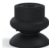
Referencia de la variante: 80A 25NI A