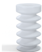
Referencia de la variante: 83 25SLT A