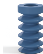
Referencia de la variante: 83 25SLBLEU A SH30