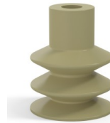
Referencia de la variante: 83 30CN A