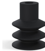
Referencia de la variante: 83 30NI A