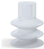
Referencia de la variante: 83 30SLT A