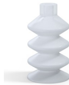
Referencia de la variante: