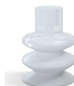
Referencia de la variante: 8B 40SLT A