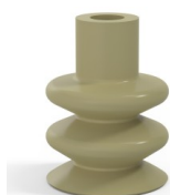
Referencia de la variante: 8B 40CN A