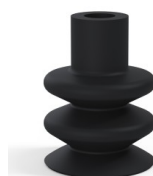
Referencia de la variante: 8B 40NI A