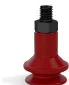
Referencia de la variante: 91 16SL M5M