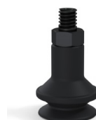
Referencia de la variante: 91 16NI M5M