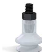
Referencia de la variante: 91 16SLT M5M