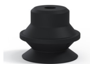
Referencia de la variante: PBG 20NI A