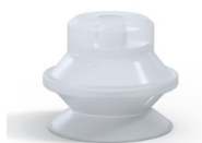
Referencia de la variante: PBG 20SLT A