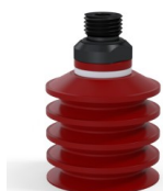
Referencia de la variante: 92 40SL 14D-2-F