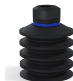
Referencia de la variante: 92 40NI 18D-2