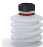
Referencia de la variante: 92 40SLT 18D-2