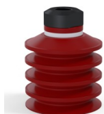
Referencia de la variante: 92 40SL 18D-2