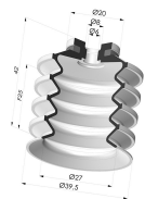
Ventosa 4.5 Fuelles Serie 92 Ø 40MM