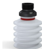
Referencia de la variante: 92 40SLT 38D-2-GIC