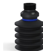
Referencia de la variante: 92 40NI 38D-2-GIC