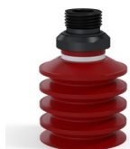
Referencia de la variante: 92 40SL 38D-2-GIC