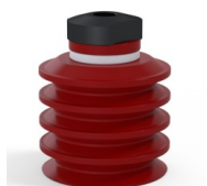
Referencia de la variante: 92 50SL 18D-2-F