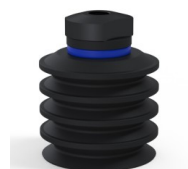
Referencia de la variante: 92 50NI 18D-2-F