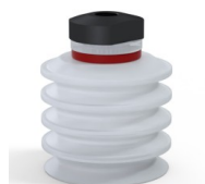
Referencia de la variante: 92 50SLT 18D-2-F