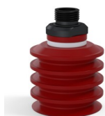
Referencia de la variante: 92 50SL 38D-2