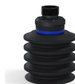
Referencia de la variante: 92 50NI 38D-2