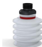
Referencia de la variante: 92 50SLT 38D-2