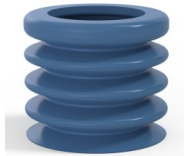
Référence déclinaison : 8K 45SLBLEU A SH30