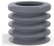
Référence déclinaison : 8K 45SLDG A