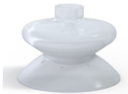
Référence déclinaison : 1 86SLT A