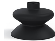
Référence déclinaison : 1 86NI A