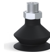
Référence déclinaison : 8SB 30NI M18