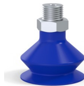
Référence déclinaison : 8SB 30TPUB M18