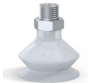
Référence déclinaison : 8SB 30SLT M18