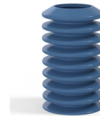
Référence déclinaison : 81A 40SLBLEU A