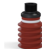
Référence déclinaison : 92 20SLBRIQUE 18D