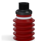
Référence déclinaison : 92 20SL M18D