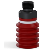
Référence déclinaison : 92 20SL M18D-5