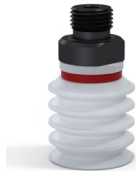
Référence déclinaison : 92 20SLT M18D-5